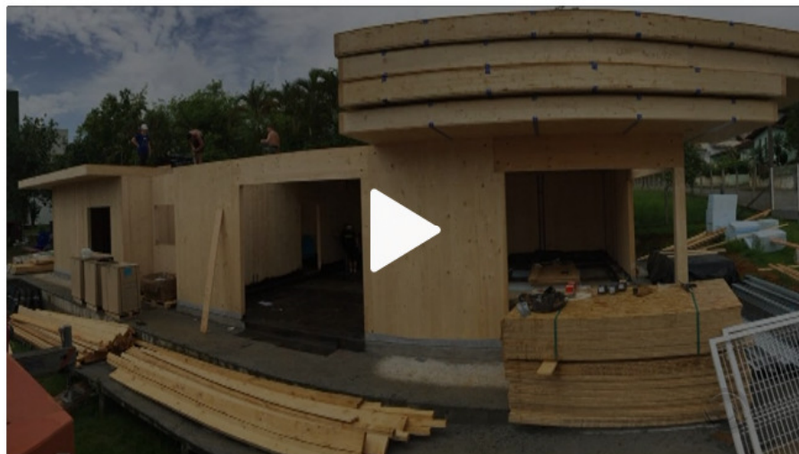
Projeto constrói e inaugura casa 100% sustentável em cidade catarinense

Por G1 SC 04/04/2017 07h15 · Atualizado há 3 horas