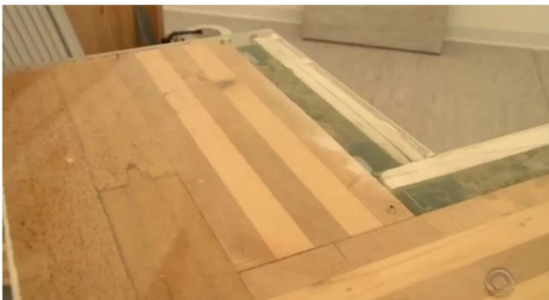
📍 Paredes de abeto tem 35 centímetros de largura

Com 35 centímetros de largura, as paredes são feitas de abeto, uma madeira semelhante ao pinus que é revestida por uma camada de lã de vidro, material semelhante ao isopor, além de gesso acartonado.